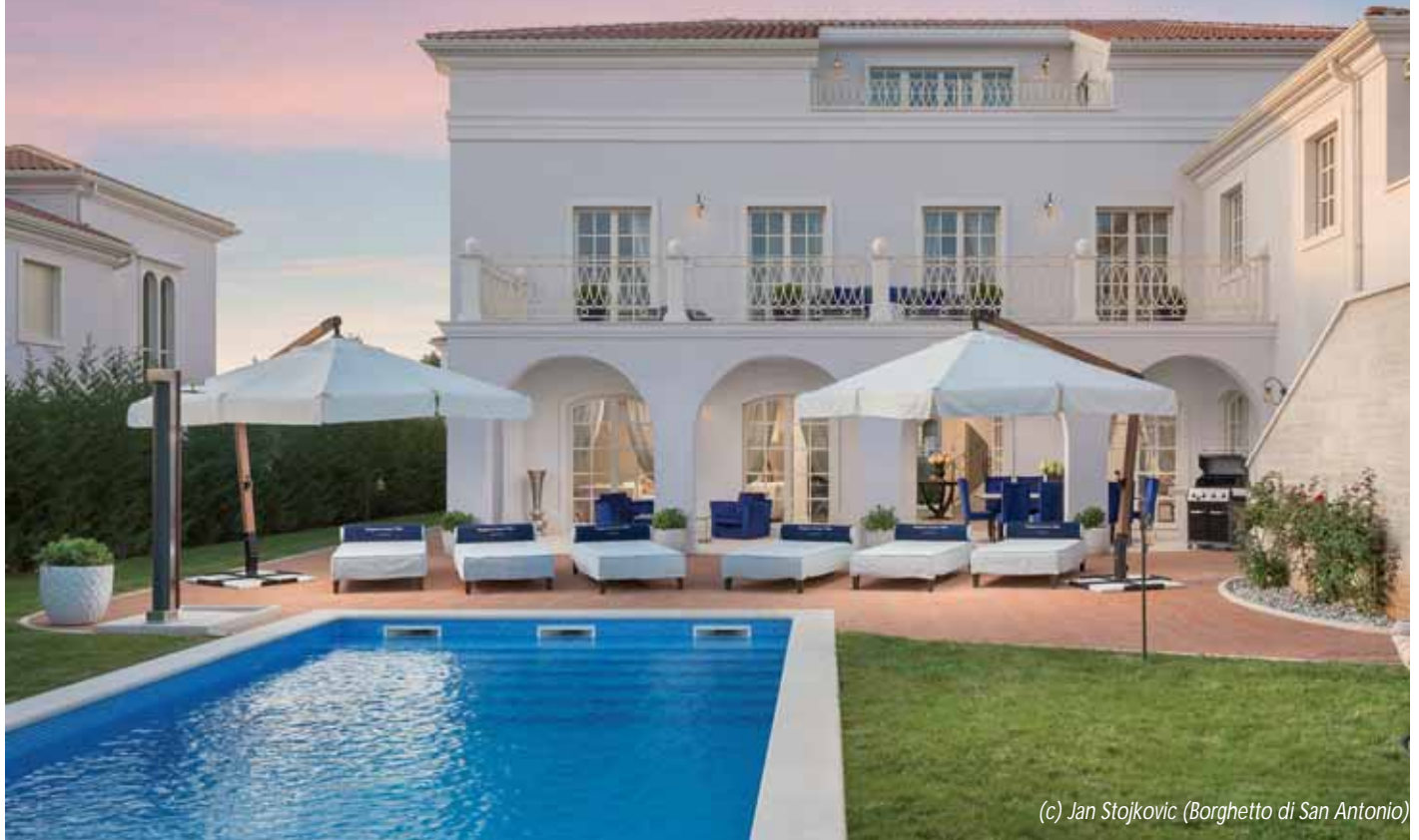
(c) Jan Stojkovic (Borghetto di San Antonio)

In den Borghetto Villas in Istrien, nur wenige Kilometer von dem Mittelmeerstädtchen Porec entfernt, finden Luxusverliebte ihr mediterranes Paradies. In der ungestörten Privatsphäre einer exquisiten Villa genießen sie grenzenlose Entspannung und erstklassigen Service. Die Schönheit von Terra Magica, wie Istrien treffend genannt wird, bildet die Kulisse eines Fünf-Sterne-Urlaubs. Blaues Meer, grüne Wiesen, der Duft der Wälder, historische Städte, istrischer Wein, Olivenhaine und goldene Sonnenuntergänge – die Lage der Borghetto Villas ist magisch, die Villen bieten modernsten Luxus. Ein Team von Tourismusexperten mit Visionen, von hervorragenden Architekten und Innendesignern hat einen Platz geschaffen, der die Sinne berührt.