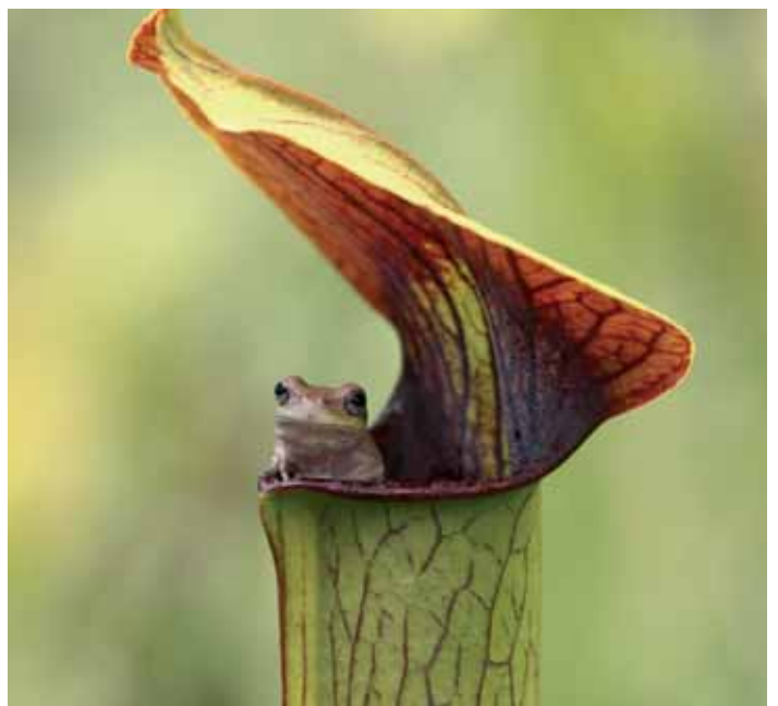
Die Schlauchpflanze Sarracenia alata zählt zu den Fleischfressenden Pflanzen. Doch manche Tiere wissen, die Falle zu überlisten, wie der amerikanische Laubfrosch als Untermieter (aufgenommen in den USA).

Von den weltweit weit über 1000 Arten gibt es Fleischfressende Pflanzen auf allen Kontinenten außer der Antarktis – auch in Deutschland sind ein Dutzend Arten heimisch. Fast immer finden sie sich in Mooren und Sümpfen. Gemeinsam ist ihnen, dass sie auf kargen, nährstoffarmen