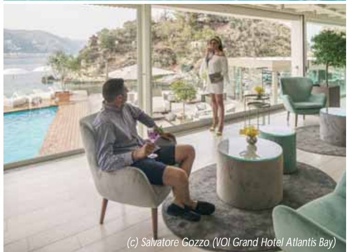
(c) Salvatore Gozzo (VOI Grand Hotel Atlantis Bay)