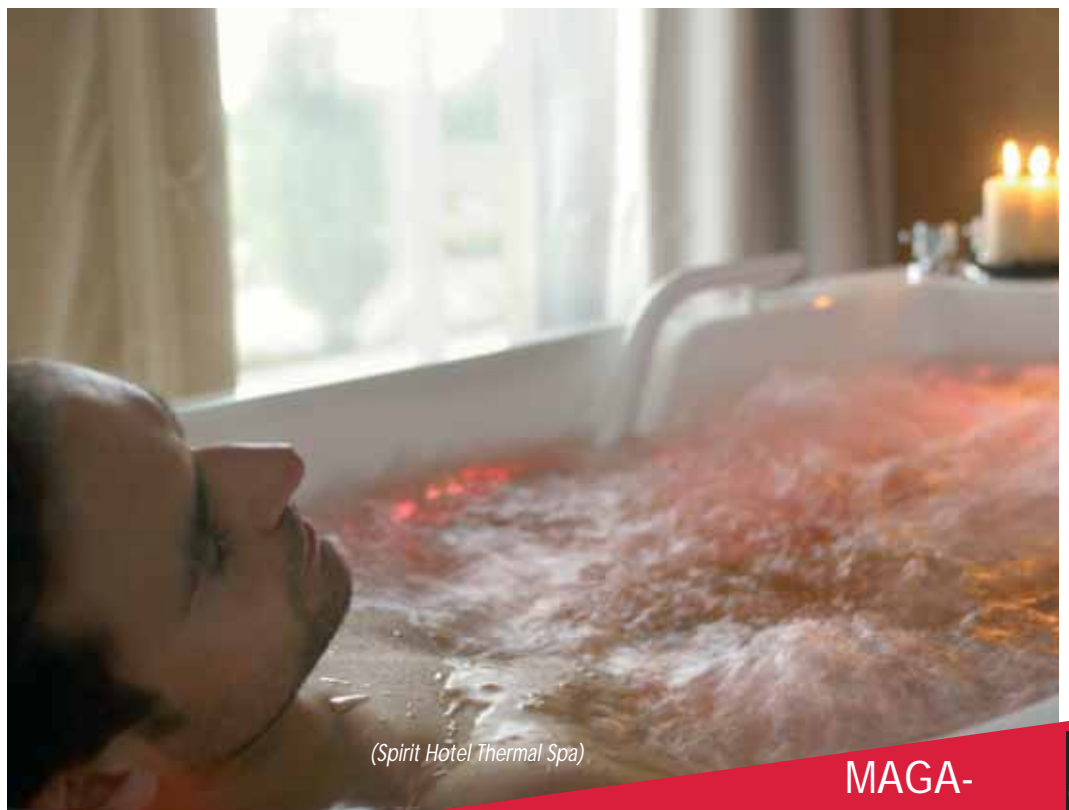
(Spirit Hotel Thermal Spa)