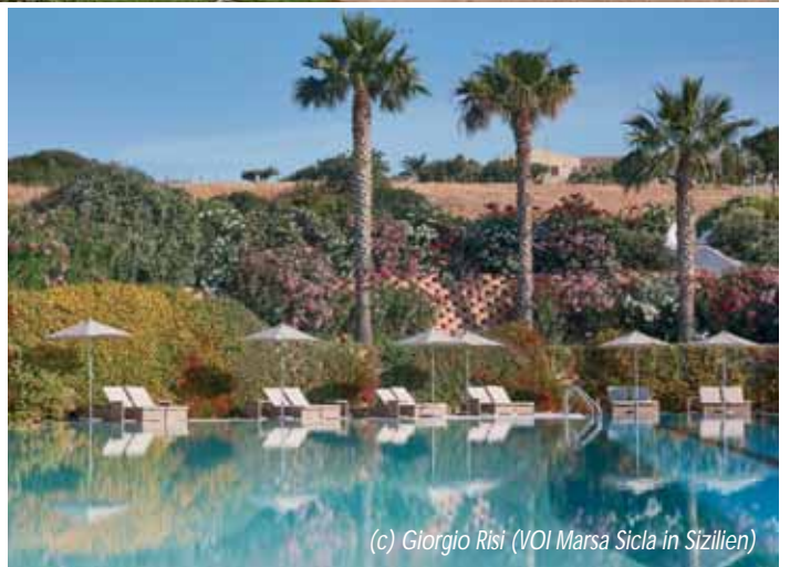
(c) Giorgio Risi (VOI Marsa Sicla in Sizilien)

https://www.voihotels.com/en/voi-marsa-sicla-resort