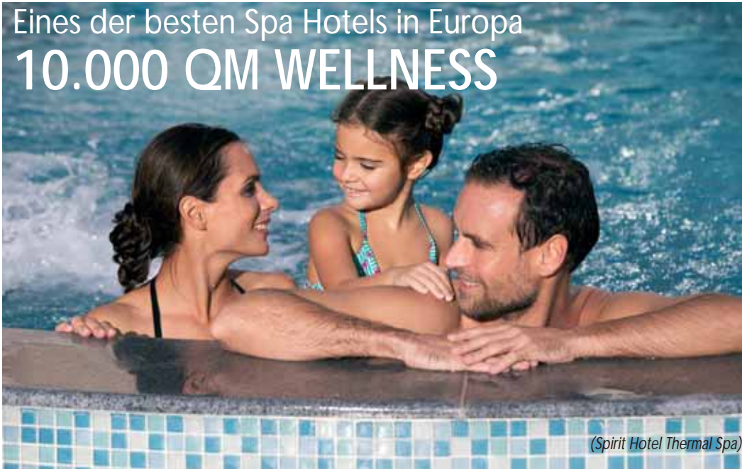
(Spirit Hotel Thermal Spa)

Größer kann ein Wellnessangebot wohl kaum noch sein. 10.000 qm ist die Badelandschaft im Spirit Hotel Thermal Spa***** im ungarischen Bad Sárvár nahe der Grenze zu Österreich groß. 22 Becken in- und outdoor bilden ein Badeparadies, das seinesgleichen sucht. Diejenigen, die aktive Erholung bevorzugen, werden im Erlebnisbecken und im 25 Meter langen Sportbecken ihren Alltagsstress los. In den Thermalbecken entspannen müde Gelenke. Massagebänke, Geysire und ein Wasserstrombecken, ei-