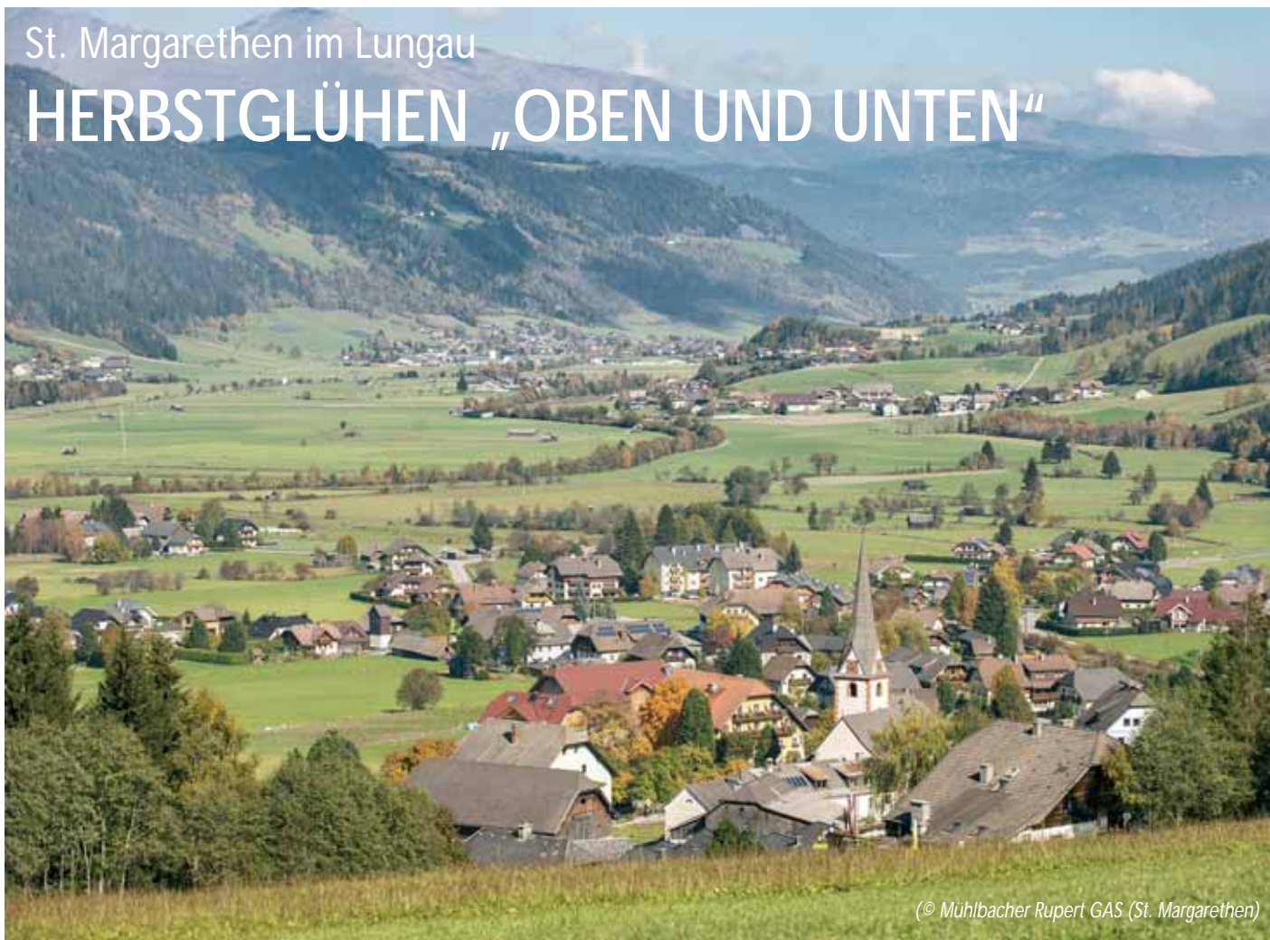
© Mühlbacher Rupert GAS (St. Margarethen)

Die glasklare Sicht, die Ruhe und die farbenprächtige Natur locken Wanderer und Biker in die Berge. Im Tal wird die Ernte eingebracht und in veredelter Form bei Almabtrieben und Bauernherbstfesten verkostet. So genussvoll ist der Herbst in St. Margarethen.