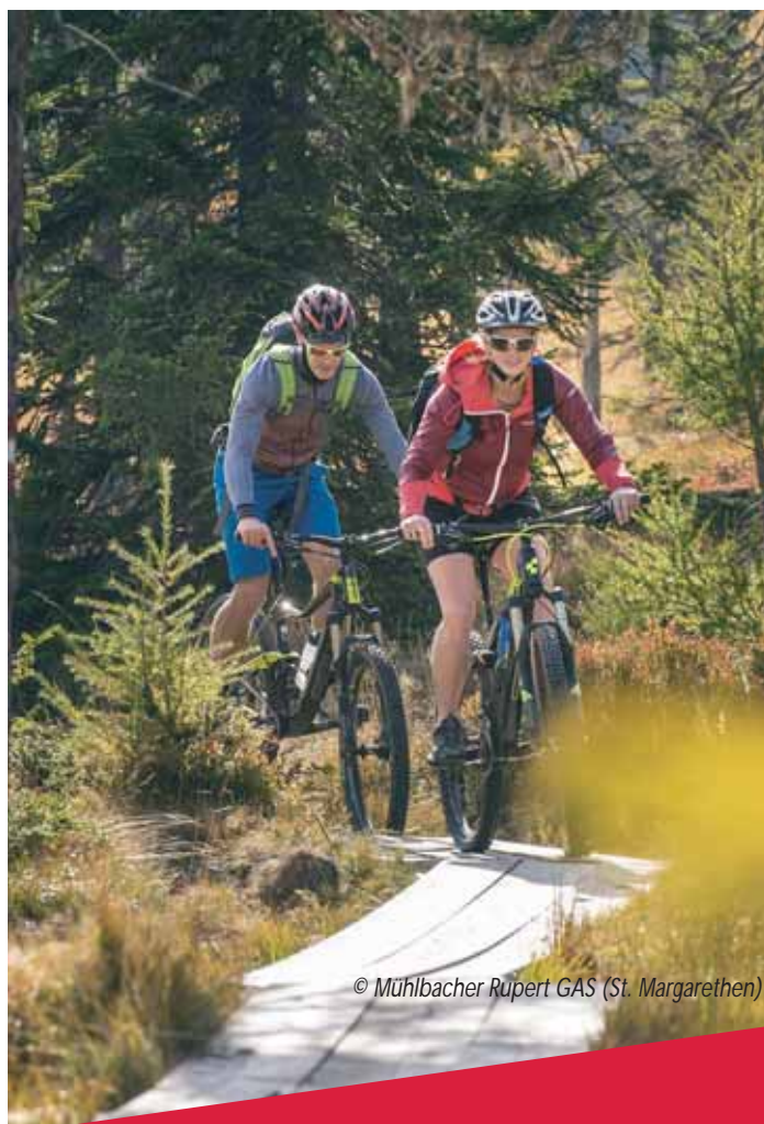
© Mühlbacher Rupert GAS (St. Margarethen)